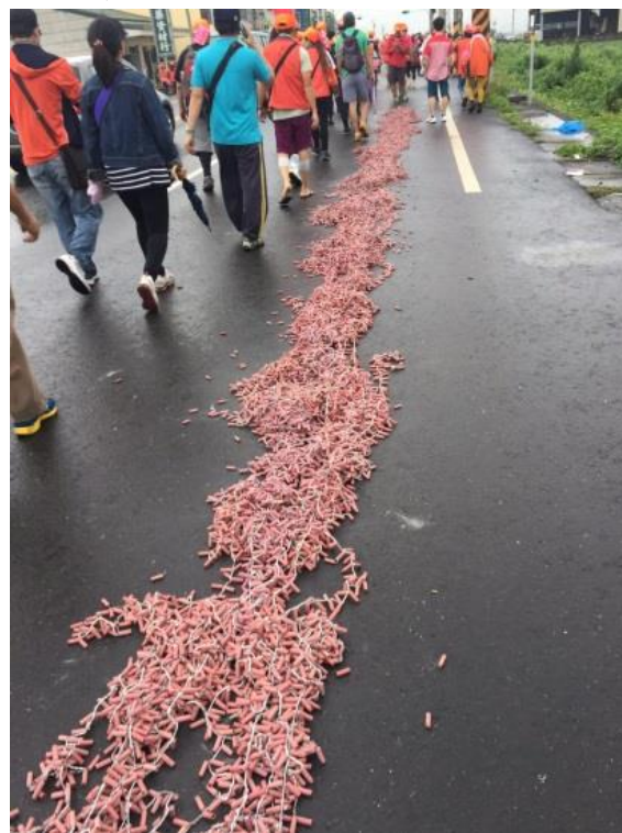
圖、串接或堆疊等錯誤燃放爆竹行為

3.民眾購買一般爆竹煙火時，應選購貼有認可標示之合格產品，並確認產品上是否具有使用說明、廠商資料及主要成分等相關資訊，以確保安全，認可標示範例如下所示。持有未附加認可標示之爆竹煙火，達中央主管機關所定管制量5分之1，處新臺幣3千~1萬5千元罰鍰。