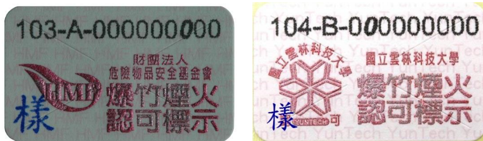
一般爆竹煙火認可標示

(三) 施放場所規定:下列地點不得施放爆竹煙火，違反者得處新臺幣 6 萬~30 萬元罰鍰。